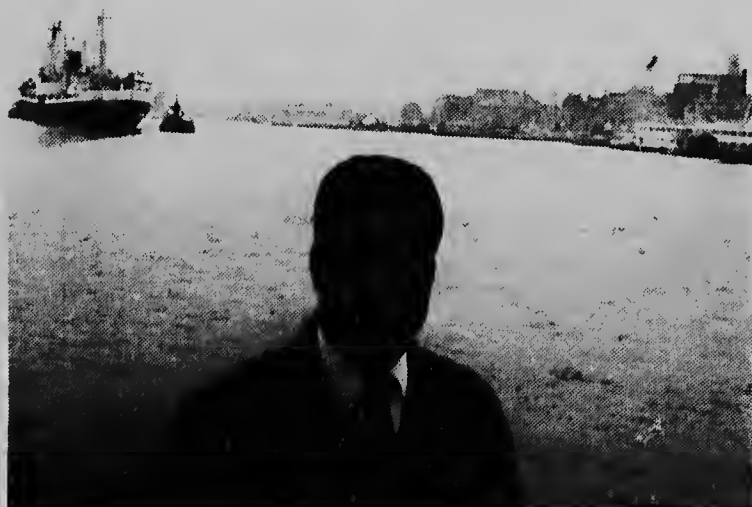
Cor Lesire ta haña Hulanda un bunita pais, caminda e tin gana di keda biba den futuro.